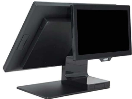
Kasse mit Touch-Monitor und grafischem Kundendisplay